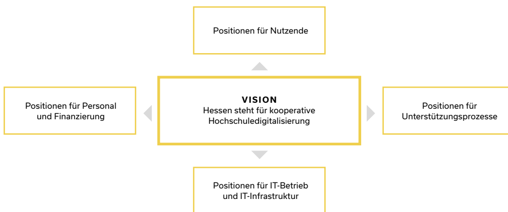
Abb. 1: Gliederung des Positionspapiers

Das eigentliche Positionspapier gliedert sich in fünf Abschnitte. In einem ersten Schritt werden – im Sinne einer Präambel – unsere Vision und unsere Handlungsgrundsätze in der Umsetzung der Digitalisierung vorgestellt. Die anschließenden vier Abschnitte stellen unsere Positionen entlang von vier Perspektiven dar, die unseren Erfolg in der digitalen Transformation maßgeblich bestimmen werden. Die folgende Abbildung verdeutlicht dies.