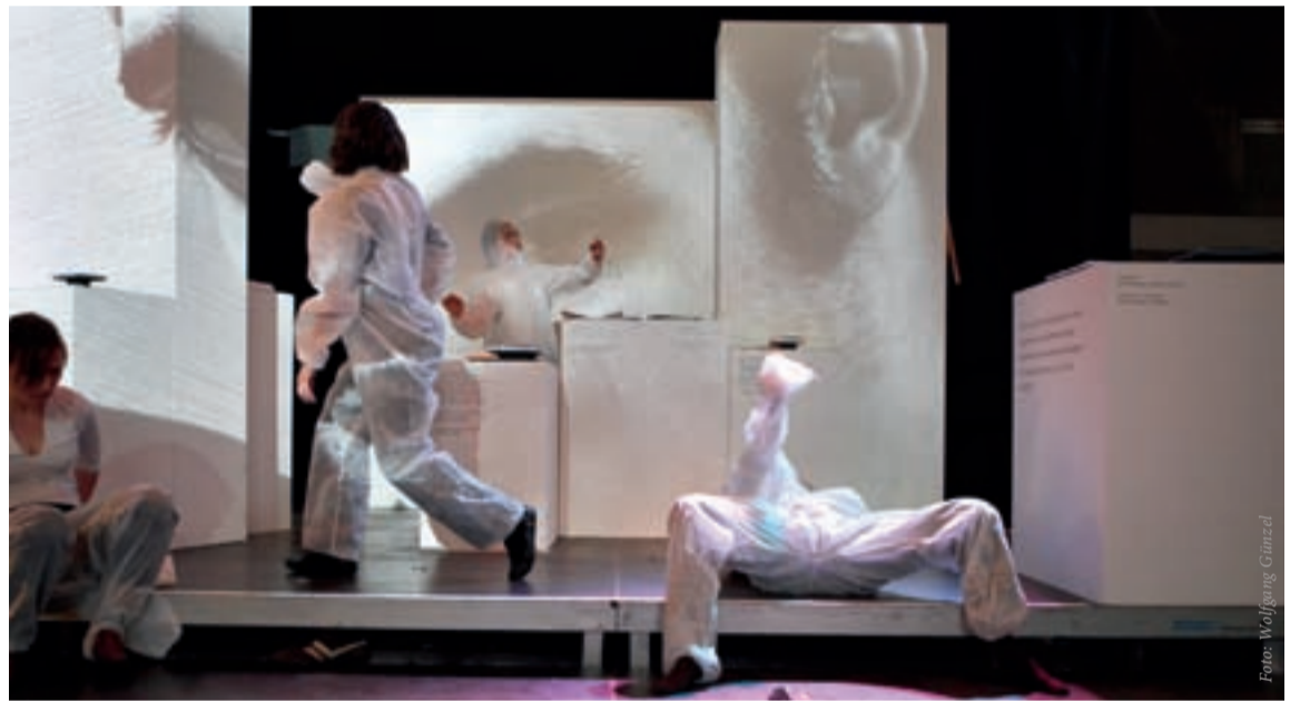
Vernissage zur Zwischenbilanz ‚Phänomen Expressionismus‘ in der Centralstation: Improvisationstanz im multimedialen Raum