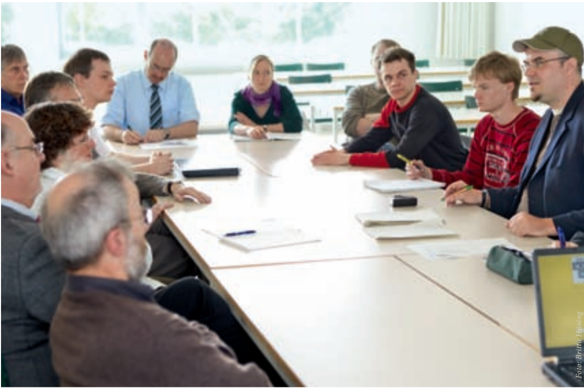
Einigkeit bei allen Diskutanten herrschte vor allem in zwei Punkten: Zum Einen, dass noch viel verbessert werden kann und muss, zum Anderen aber auch, dass die h_da in vielen Bereichen deutlich besser ist, als andere Hochschulen.